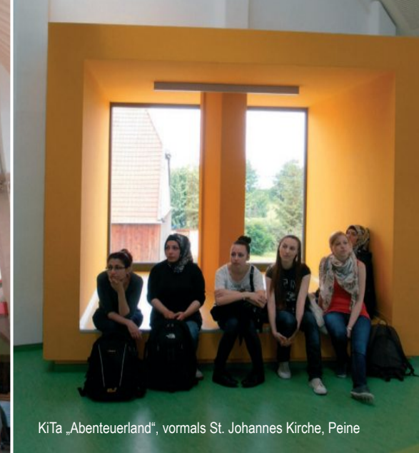
KiTa „Abenteuerland“, vormals St. Johannes Kirche, Peine