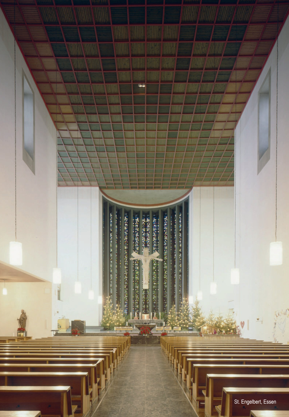
St. Engelbert, Essen

Fendrich, der Kunstbeauftragte des Bistums, heute die größte Problemzone des Bestands dar, da sie nicht so einfach abzureißen, aber auch nur schwierig umzunutzen seien, da mit besonderen Anforderungen und Auflagen, möglicherweise gar denkmal-pflegerischen, belastet.