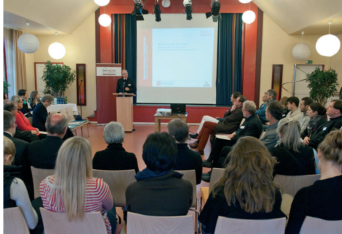
Veranstaltungsort: Werkstatt Süd, Hölderlinstraße 56, 30159 Hannover

Die evangelische Kirche in Hannover unterhält derzeit 70 Kirchen, die ursprünglich für rd. 400.000 Mitglieder gebaut wurden. Heute sind es noch rd. 200.000, so dass die Kirche rein rechnerisch 50% zu viel Gebäude besitzt. Fünf Kirchen wurden in den letzten Jahren entwidmet und einer neuen Nutzung zugeführt. Weitere müssen folgen. An vielen Stellen verursacht dies heftige öffentliche Diskussionen. Vor diesem Hintergrund wurde eine Arbeitskreis „Stadt und Kirche“ gegründet, der das Thema „Rückzug der Kirchen? Konsequenzen für die Stadt. Auf der Suche nach neuen Synergien“ unter baukulturellen Aspekten aufarbeitet. Der Arbeitskreis führte im Juni 2012 drei Exkursionen zu umgenutzten und neu gestalteten Kirchengebäuden in Südost-Niedersachsen durch. Die daraus entstandenen Diskussionen fließen in die Gestaltung des 7. Netzwerkforums im November 2012 in Hannover ein.