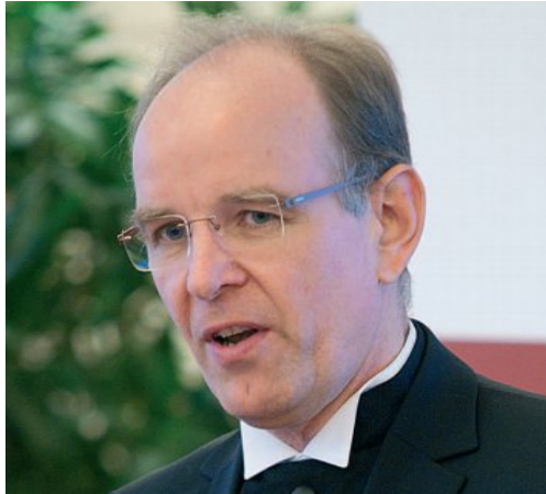
Landesbischof Ralf Meister

Studium der Evangelischen Theologie in Hamburg