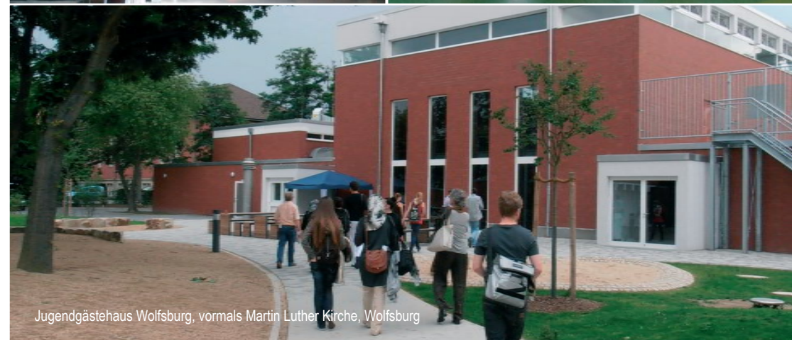
Jugendgästehaus Wolfsburg, vormals Martin Luther Kirche, Wolfsburg