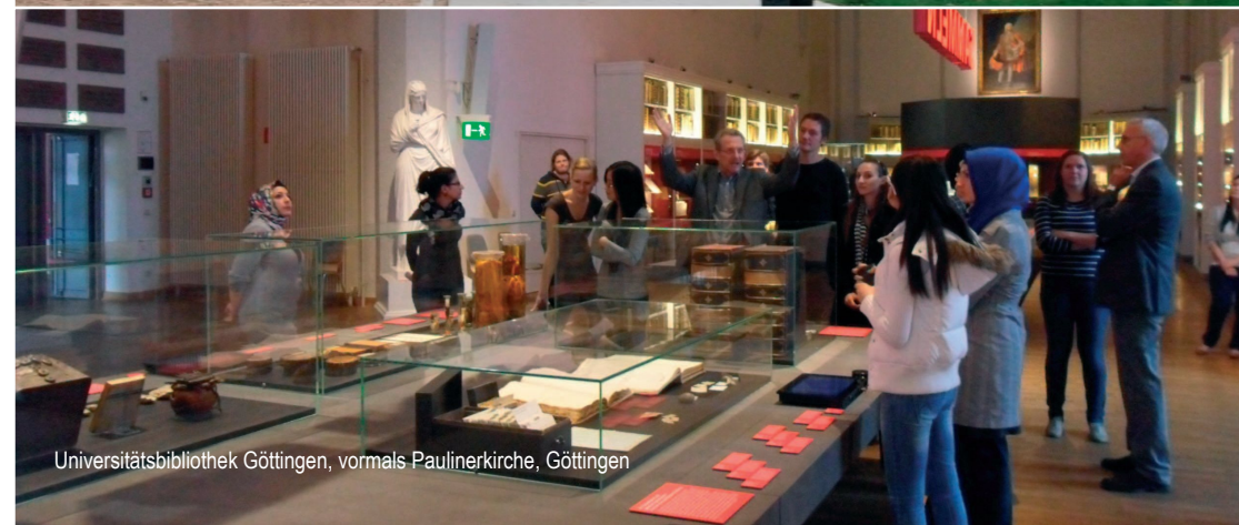
Universitätsbibliothek Göttingen, vormals Paulinerkirche, Göttingen