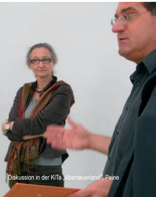
Diskussion in der KiTa „Abenteuerland“, Peine

Der Arbeitskreis „Stadt und Kirche“ hatte sich Anfang 2012 mit dem Ziel konstituiert, Kirchenumnutzungen als baukulturelles Thema in die Öffentlichkeit zu tragen und einen breiteren Diskurs anzustoßen. Hier war die Idee entstanden, öffentliche Exkursionen zu umgenutzten Kirchengebäuden durchzuführen und Studierende in die Vorbereitungen einzubeziehen. Die Exkursionen ins südliche und östliche Niedersachsen sowie in die Stadt Hannover zeigten eine große Bandbreite an durchgeführten und im Bau befindlichen Umnutzungen von Kirchen, die viel Anlass zu kontroversen Diskussionen lieferten: Wie weit darf man gehen? Welches sind die „richtigen“ Zwecke für Umnutzungen? Darf es ein Kolumbarium sein, ein Chorhaus oder eine Bibliothek? Darf christ-