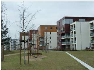
Neue Burg, Detmerode

Detmerode und Westhagen im Focus des 5. AK Kommunen