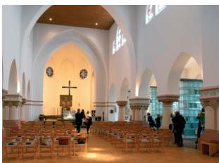
Herz-Jesu-Kirche, Kolumbarium Misburg

Aufgrund rückläufiger Zahlen der Kirchenmitglieder unterhält die evangelische Kirche in Niedersachsen zu viele Gebäude und wird sich in absehbarer Zeit von baukulturell bedeutendem Bestand mit entsprechender Auswirkung auf die betroffenen Stadtteile bzw. Städte trennen müssen. Vor diesem Hintergrund hat sich Anfang des Jahres der neue Arbeitskreis „Stadt und Kirche“ zusammengefunden und das Thema „Rückzug der Kirchen? Konsequenzen für die Stadt.“