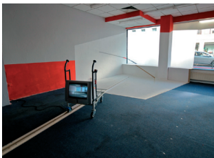
Rauminstallation von Johannes Langkamp

Tangency sucht Stadtberührungen. Dafür sind künstlerische Interventionen vorgesehen, die im öffentlichen und offenen Stadtraum angesiedelt sind. Das Spannungsverhältnis zwischen Stadtkörper und Menschenleib, diese unbestimmt erscheinende Membran des Dazwischen, soll wahrnehmbar werden. Wie sehr die Stadt als Zusammenwirken von Oberflächen im Raum erfahren wird, wie sehr Materialien und Pflanzungen zusammen eine Atmosphäre des Städtischen entfalten, in der sich der Leib des Menschen bewegt, das ist die Inspiration dieses Projektes. Als konkreter Raum der Umsetzung diente der gerade fertiggestellte Rosenplatz in Osnabrück.