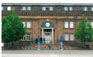
Preußenmuseum Minden Veranstaltungsort