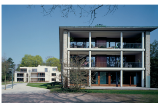
Reemtsma Park, Hamburg Helmut Riemann Architekten, Lübeck

Die Nachkriegszeit in Deutschland wurde geprägt von der Beseitigung eklatanter Versorgungsdefizite, der Reparatur umfassender Kriegszerstörungen und der Herausforderung des Wiederaufbaus. Angesichts der dabei vollbrachten quantitativen Bauleistungen wird oft übersehen, dass auch die Baukultur in Deutschland in jener Zeit wichtige Impulse erhalten und gegeben hat. Viele Gebäude aus diesen Jahren sind aufgrund ihrer funktionalen Qualität, ihrer Versorgungsfunktion oder ihrer baukulturellen Bedeutung auch für die Zukunft unverzichtbar. Allerdings sind in der Regel umfassende und grundlegende Erneuerungen erforderlich. Dies gilt für ein besseres Energiekonzept für Gebäude, für Anpassungen an veränderte Parameter ihrer bisherigen Nutzung oder für eine Anpassung an ganz andere, neue Nutzungen. Der Gestaltungspreis der Wüstenrot Stiftung „Zukunft der Vergangenheit – Die Erneuerung von Gebäuden der Baujahre