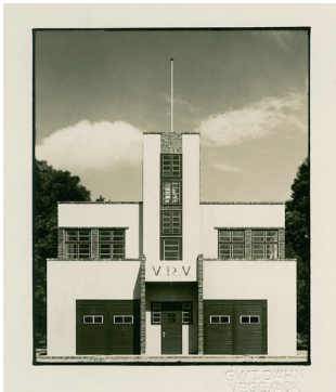
Ernst Becker: Bootshaus des Rudervereins Vegesack, Bremen 1927

Neue Baukunst – Architektur der Moderne in Bild und Buch