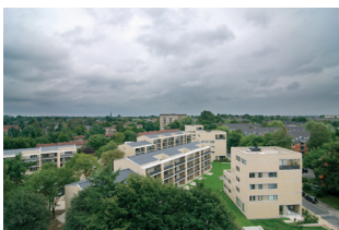
Wohnquartier Althenhagener Weg, Hamburg Springer Architekten, Berlin

Zukunft der Vergangenheit – Die Erneuerung von Gebäuden der Baujahre 1945 – 1979