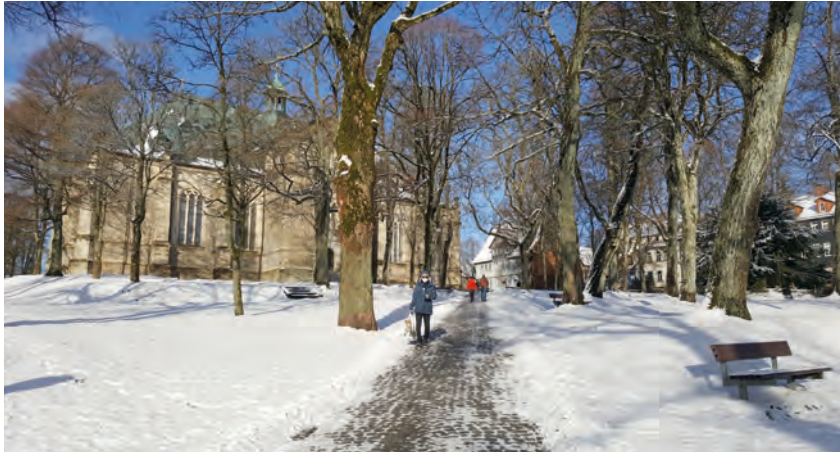
Die Tebra-Terrassen – Ein gartenkulturelles Kleinod in Clausthal-Zellerfeld ist zu entdecken.

Der niedersächsische Teil des Harzes verfügt mit seinen Bergwiesen und Wäldern oder mit seinem weitverzweigten System aus Teichen und Kanälen der Oberharzer Wasserwirtschaft über eine besondere landschaftliche Vielfalt und Biodiversität. Sie hat sich über Jahrhunderte im Zusammenspiel mit dem Bergbau, Kurbetrieb und dem Tourismus entwickelt und spiegelt sich auch in der Baukultur mit seinen Gärten und Parks und regionalen Bauweisen wider. Ende 2021 startete das Projekt „Garten- und Landschaftskultur als Beitrag zur nachhaltigen Regionalentwicklung - Ansätze, Methoden, Übertragbarkeit“, um Wandel und aktuelle Veränderungen im Harz positiv zu unterstützen.